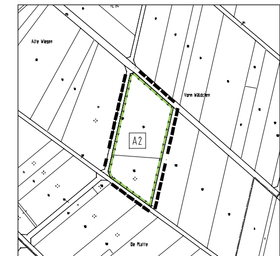
Lage der externen Kompensationsfläche (A 2)

Gemarkung Wolferborn, Flur 24, Pz. 104 u. 105 (insg. ca. 5.500 m²)