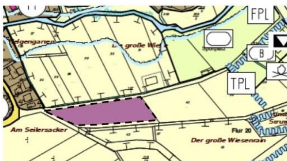
Abb.: Geltungsbereich der Flächennutzungsplanänderung genordet, ohne Maßstab

Der Geltungsbereich des Bebauungsplans / Änderungsbereich des Flächennutzungsplans ist in der abgedruckten unmaßstäblich verkleinerten Karte durch eine unterbrochene Linie kenntlich gemacht.