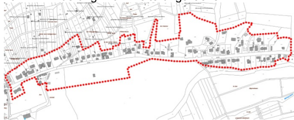
Abb. Geltungsbereich des Bebauungsplans Nr. 40 „Am Hain“ 1. Änderung mit Erweiterungsflächen

Mit dieser Bekanntmachung tritt die Veränderungssperre in Kraft. In diesem Bereich dürfen somit keine Veränderungen gem. § 14 Abs. 1 BauGB durchgeführt werden.