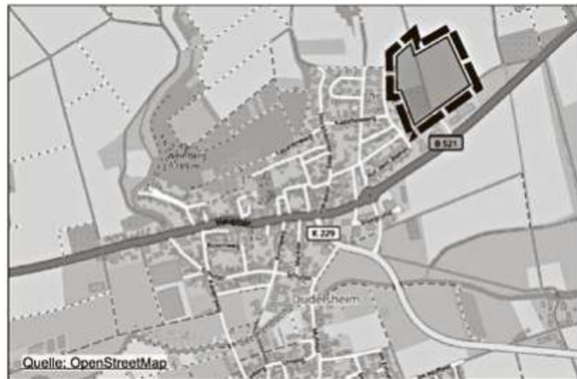
Abb. Lage- und Übersichtskarte des Gebiets

Die Vorbereitung und Durchführung der gesetzlichen Beteiligungsschritte wurde einem privaten Planungsbüro (Einschaltung eines Dritten gemäß § 4b Baugesetzbuch) übertragen.